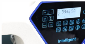
可增加语音播报，一键直达