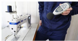
步进电机控制倒缝无声，给你安静舒适的工作环境。