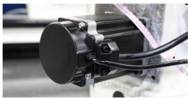
步进电机控制针距，精度到0.1mm。