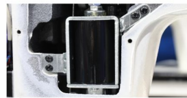
电磁铁抬压脚，方便快捷。